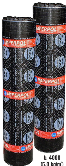
a. 3000 (4,3 kg/m 2 )